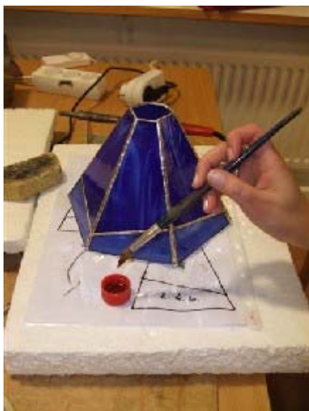
En vacker lampskärm i två blå färgnyanser patineras.