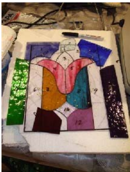
Många små glasbitar i olika färger ska bilda en helhet. Gunnevi Numelins arbete växer fram.